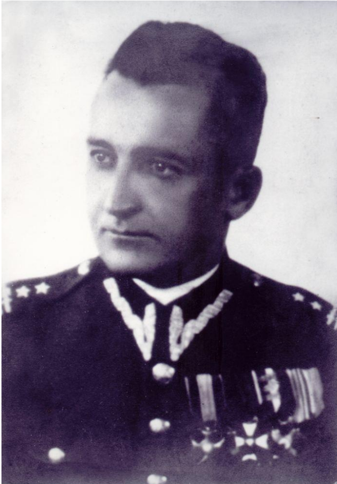
Generał August Emil Fieldorf ps. „Nil”