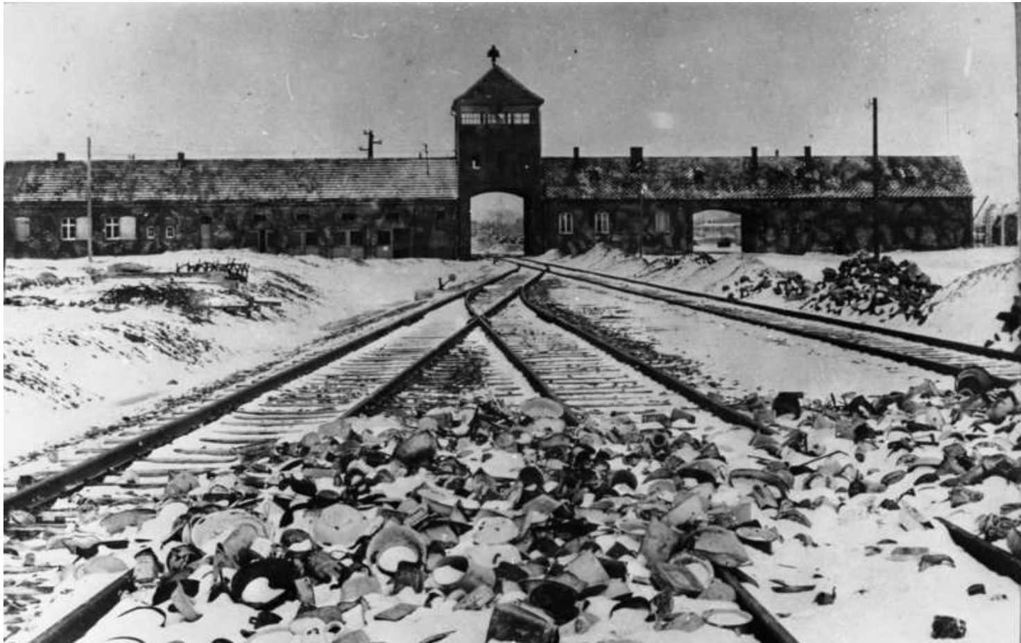
Auschwitz Birkenau (Oświęcim – Brzezinka)