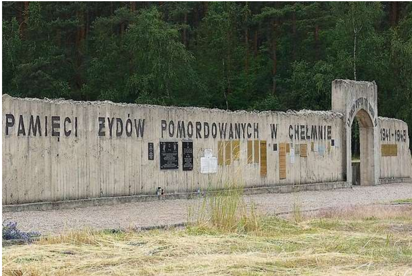
Kulmhof (Chełmno nad Nerem)