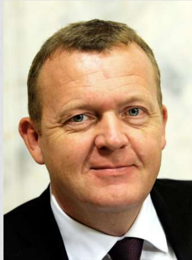
Premier Danii Lars Løkke Rasmussen