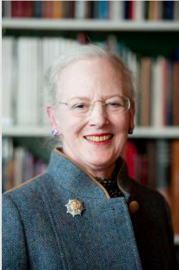
Królowa Danii Małgorzata II