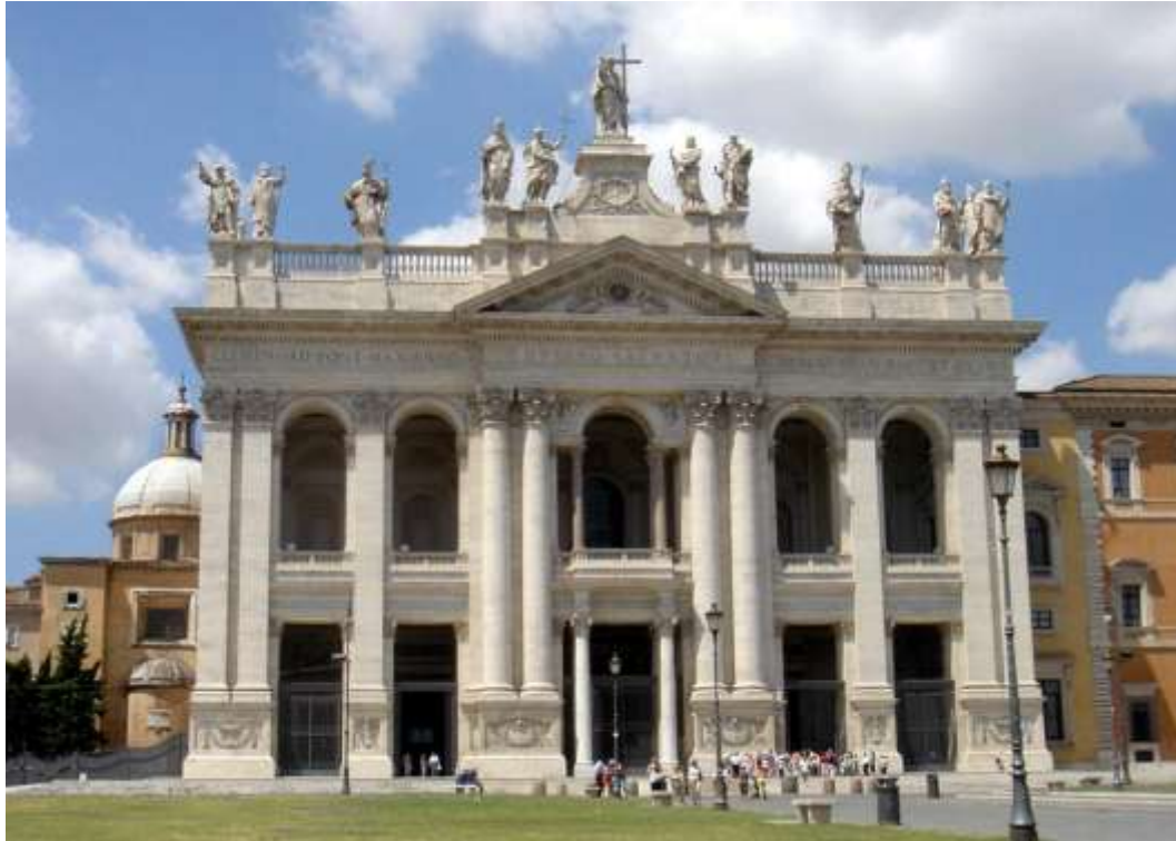
Bazylika św. Jana na Lateranie