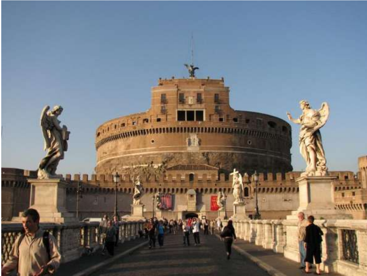
Zamek Świętego Anioła