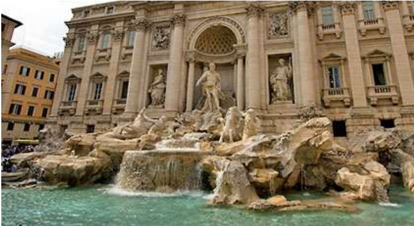
Fontanna di Trevi