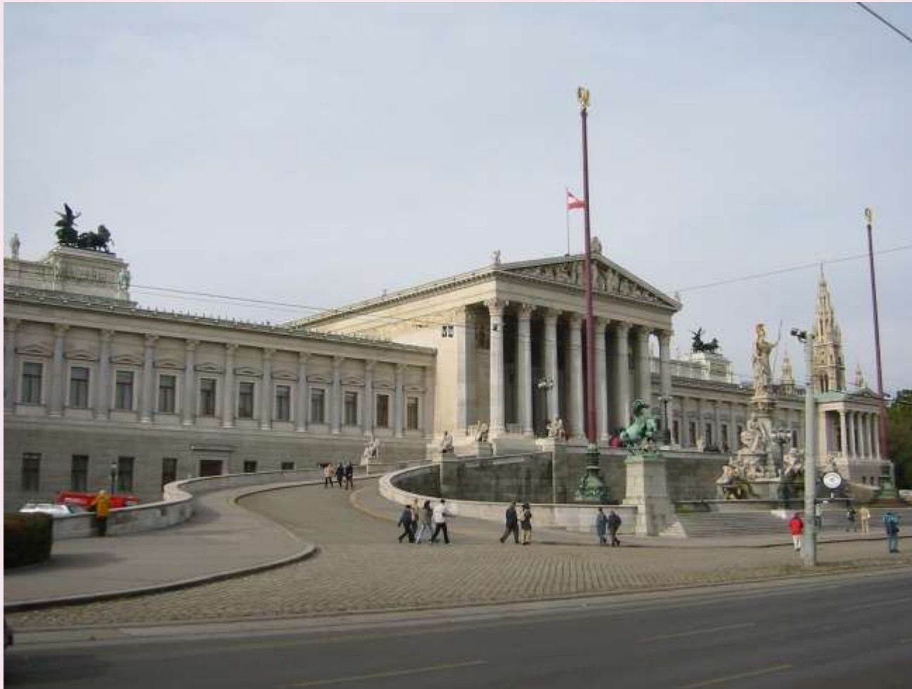
Budynek Parlamentu w Wiedniu